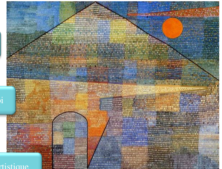
Paul Klee 1879-1940