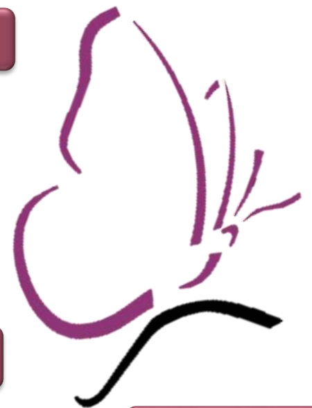
Quelques exemples d'ateliers